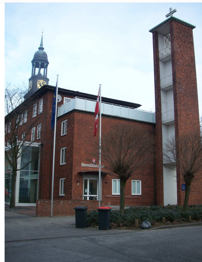
Benediktekirken - Dansk Sømandskirke Hamborg